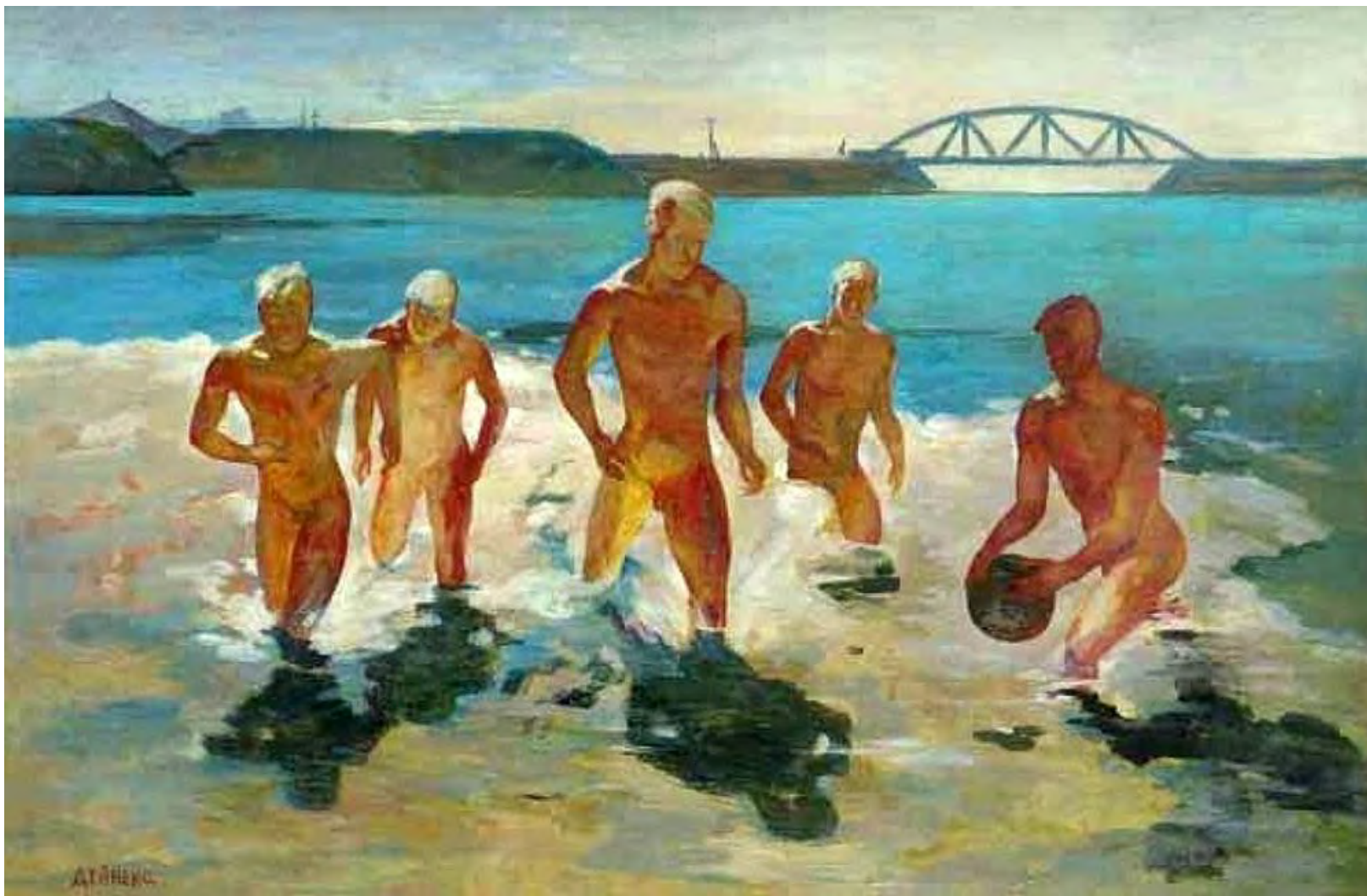
А. Дейнека. Мальчики, выбегающие из воды (1930-35 гг)