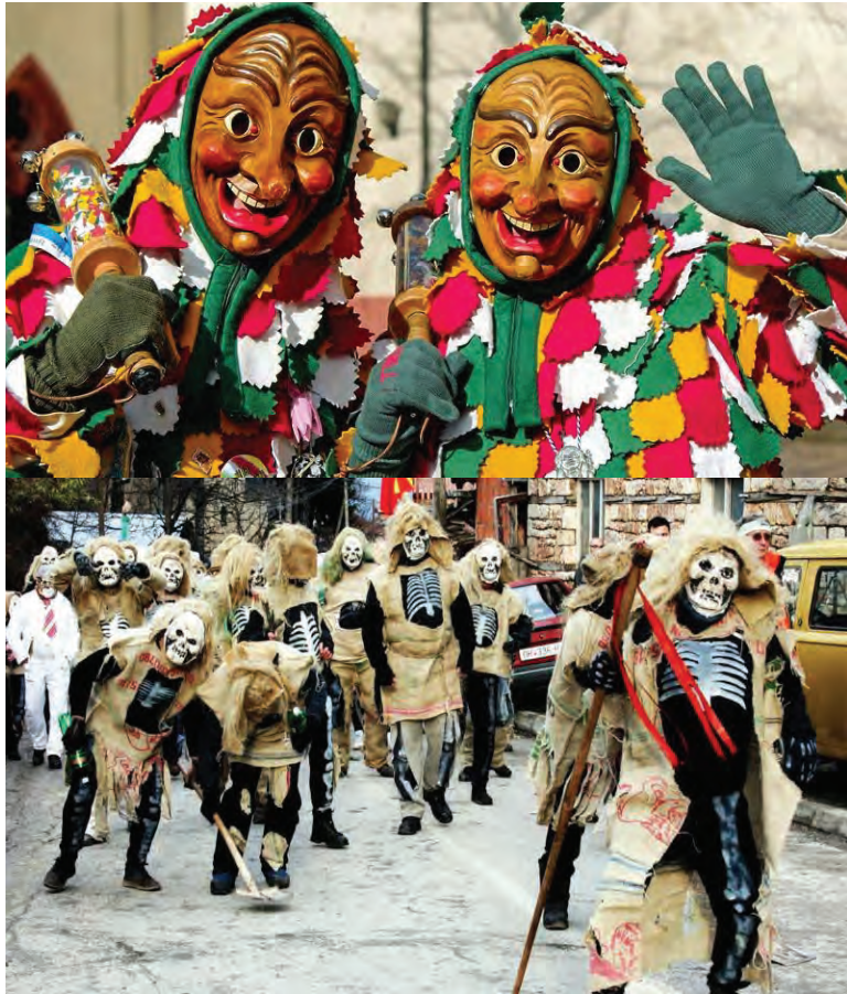
Карнавал в Македонии